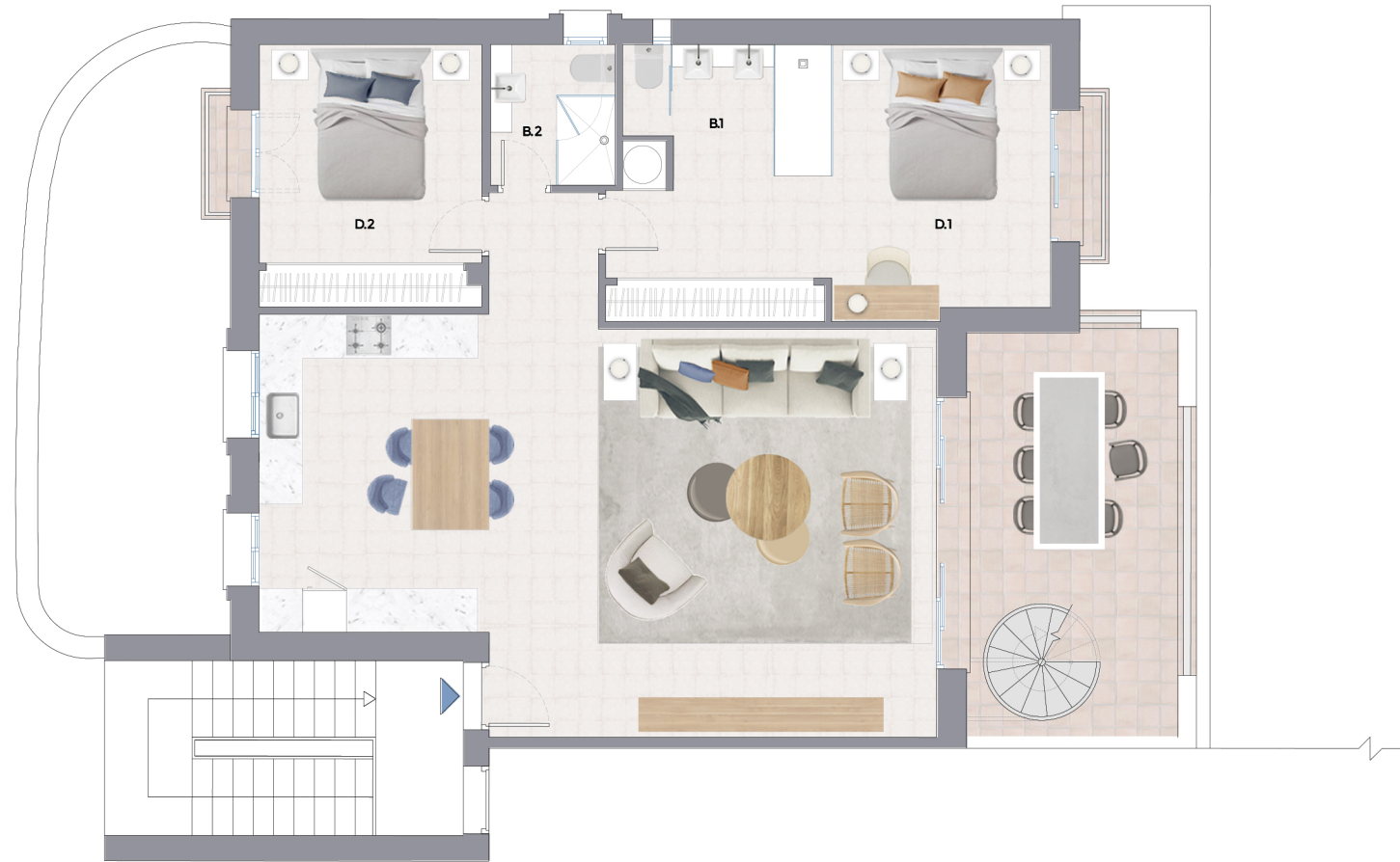
PLANTA ALTA BLOQUE 37 APARTAMENTO 4 VIVIENDA TIPO "B" MEDIANERA