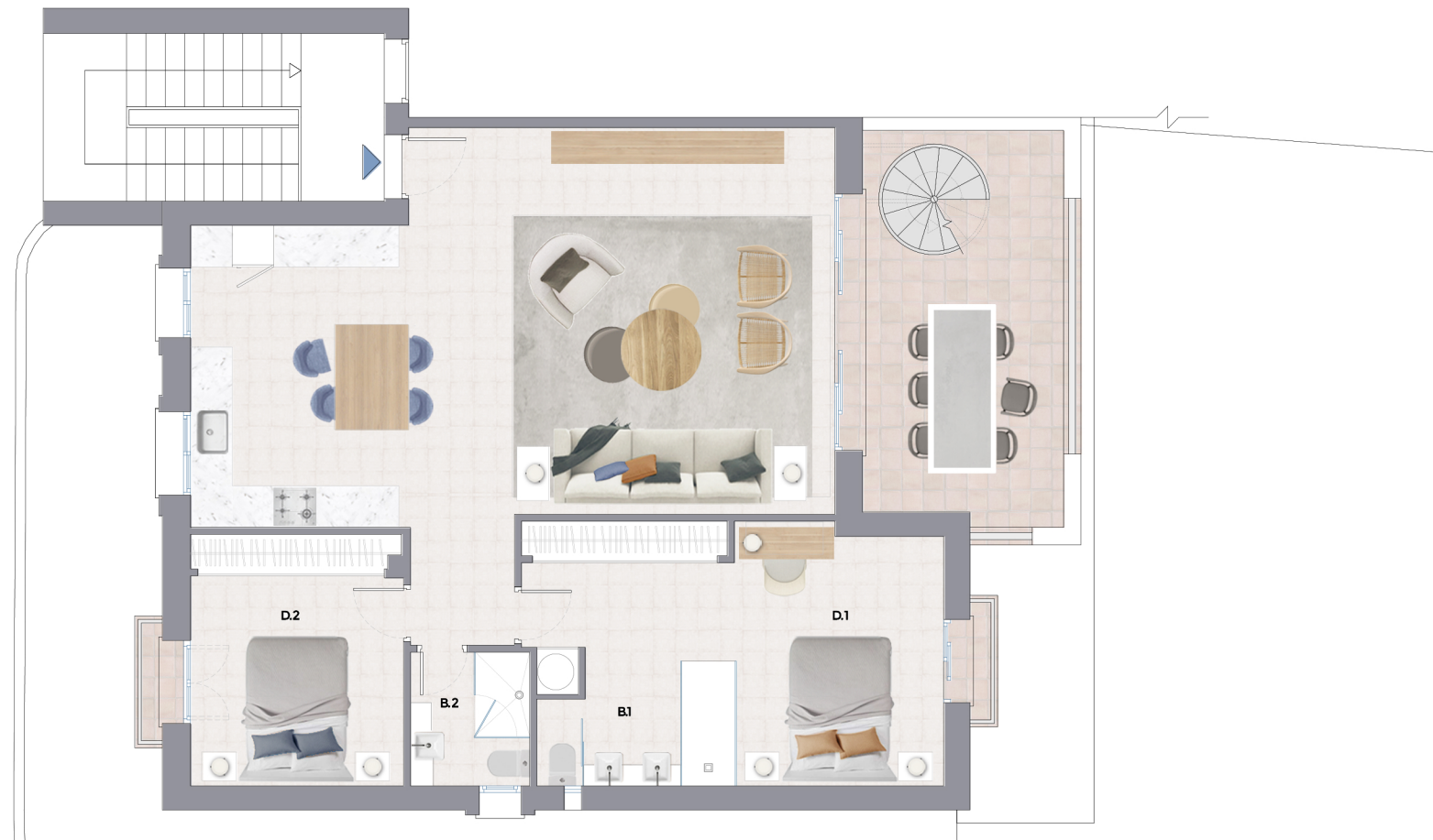
PLANTA ALTA BLOQUE 39 APARTAMENTO 3 VIVIENDA TIPO "B" MEDIANERA